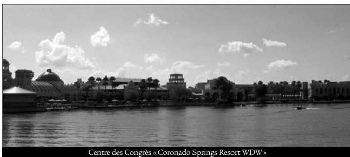
Centre des Congrès « Coronado Springs Resort WDW »

présentées, réparties en 15 sessions thématiques. De plus, 20 autres sujets furent abordés sous forme de session d'affichage où il était possible de discuter directement avec les auteurs.